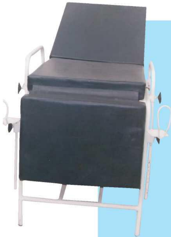
Table de gynécologie