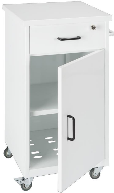
Table de chevet en tôle de 10/10ème traité et peint en blanc