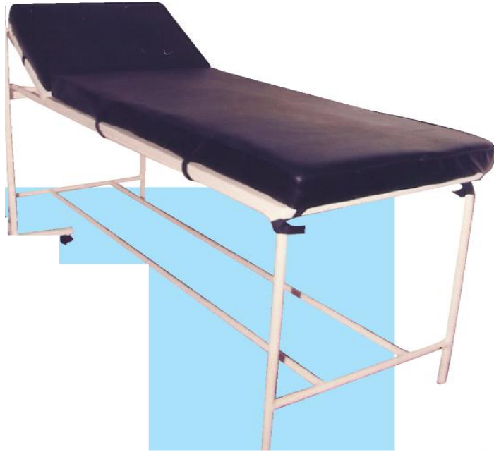
Table de consultation