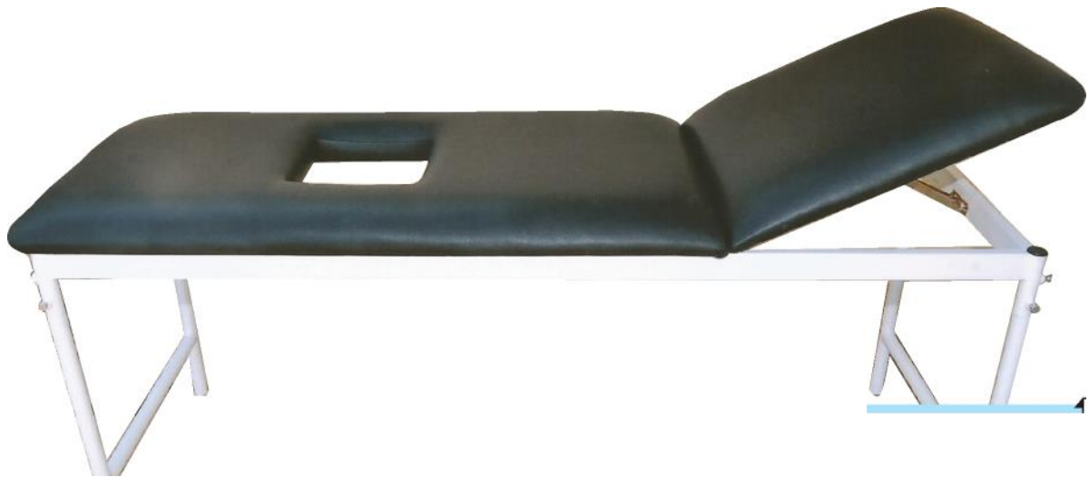
Table de pansement