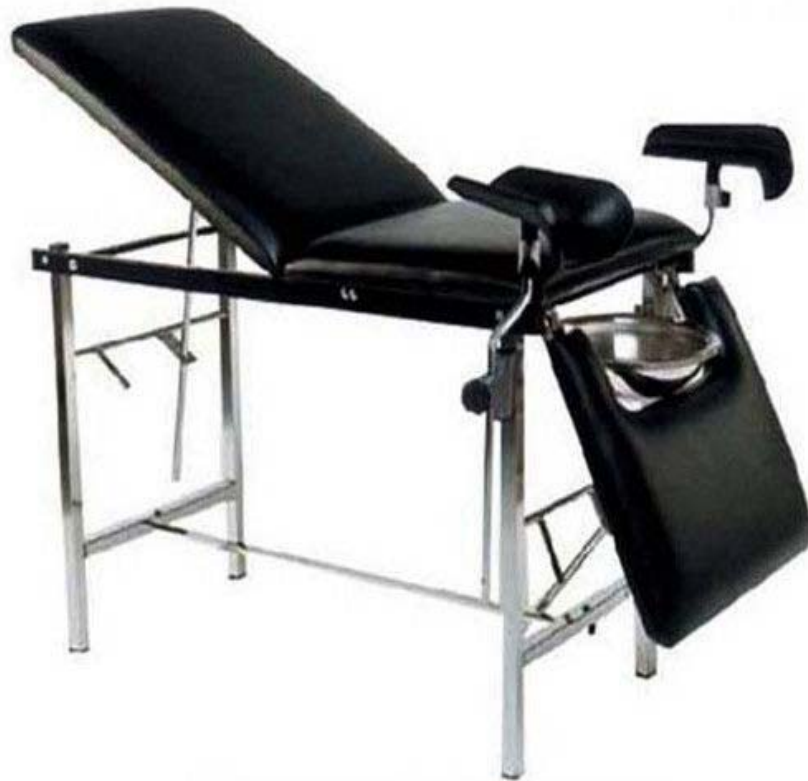
Table d'examen gynécologique