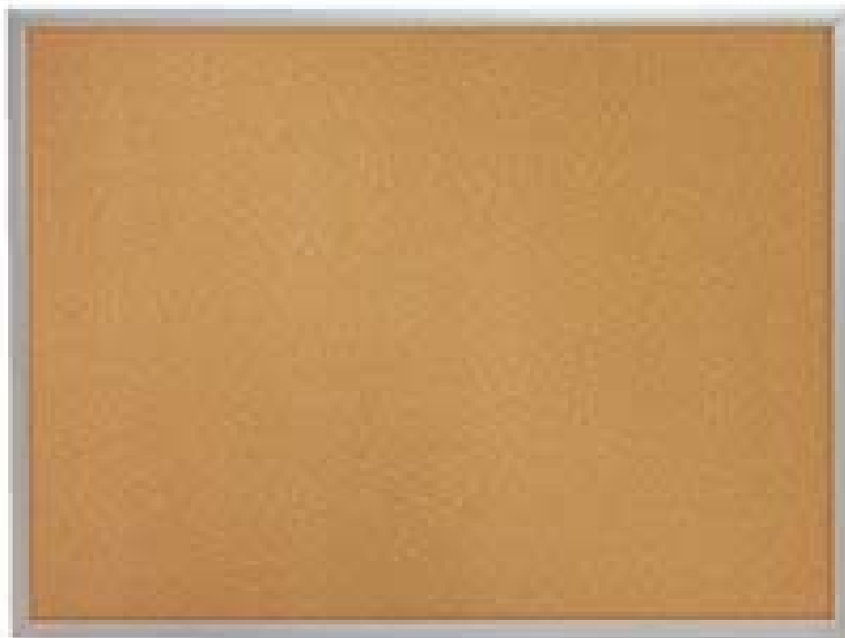
Tableau d'affichage en bois