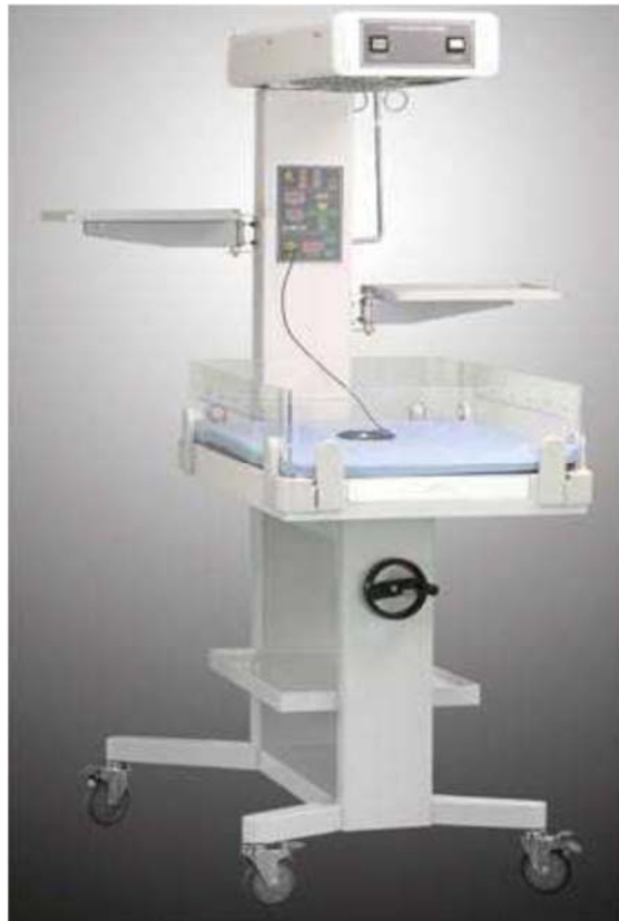
Table de réanimation néonatale destinée aux soins du nouveau-né au bloc opératoire et à la maternité