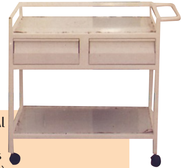
Table de gynécologie